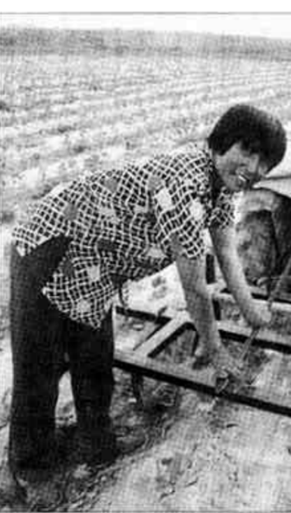
广饶县广饶镇始终把民营经济作为全镇经济快速发展的突破口,摆上党委政府的重要议事日程。

培植典型带动。该镇将渤海集团、华龙工贸公司、驰中食品有限公司和祥龙化工有限公司四大集团作为重点培植对象,在扩大企业规模的同时,不断加强产品的科技含量。渤海、洁源、华龙、驰中等企业相继建立了自己的研究所或技术开发中心,并与山东大学、天